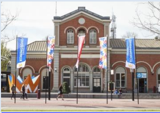
Het station in Dordrecht.