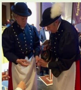
Twee marketensters in originele kledij.

NieuwsFlitZ is een uitgave van KBO Zeeland.