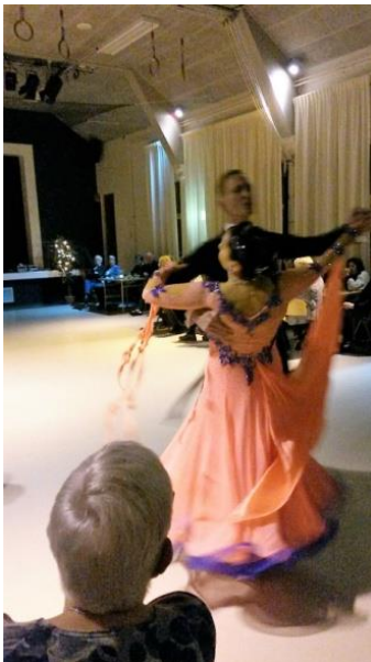
Een fraaie verrassing: een dansdemonstratie.

Voor al het nieuws vanuit KBO Zeeland kijkt u op onze website www.kbozeeland.nl